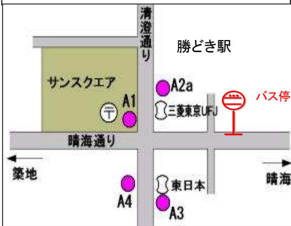
都営大江戸線勝どき駅バス乗り場