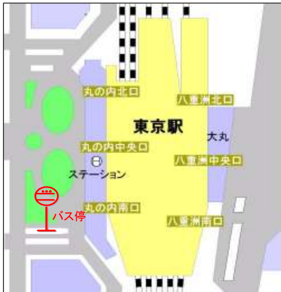
JR 東京駅丸の内南口バス乗り場